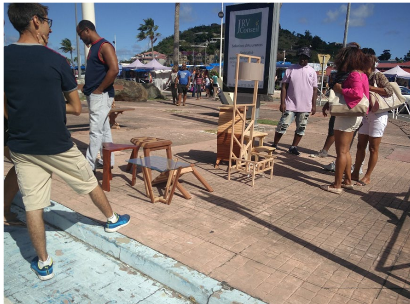
© Lycée polyvalent des Îles du Nord

« En Guyane, il y a plus de matériel et plus de bois pour réaliser les assemblages ou les panneaux. J'ai appris de nouvelles techniques de travail et j'ai pu réaliser des tables rondes. Après le bac Pro, j'ai l'intention de m'inscrire en BTS».