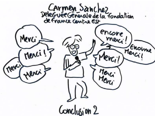
Florence Dupré La Tour©