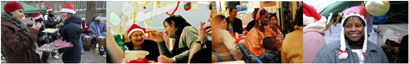
© E. Simiand / A. Pinoges / S. le Clézio