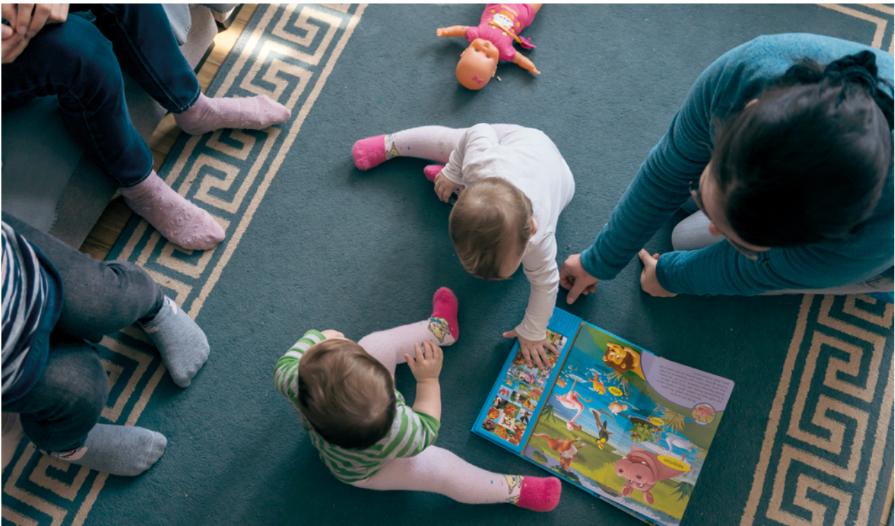
Le centre Hope and Homes accueille des enfants réfugiés en Roumanie.

Enfin, en Pologne , la Fondation Saint-Nicolas , association caritative polonaise qui œuvre pour les enfants depuis une vingtaine d'années, a lancé un appel à projets auprès de la société civile polonaise afin d'aider les enfants réfugiés ukrainiens en leur proposant des activités, un soutien psychologique, des cours de langue, des fournitures et du soutien scolaire... Dix de ces projets sont soutenus par la Fondation de France.