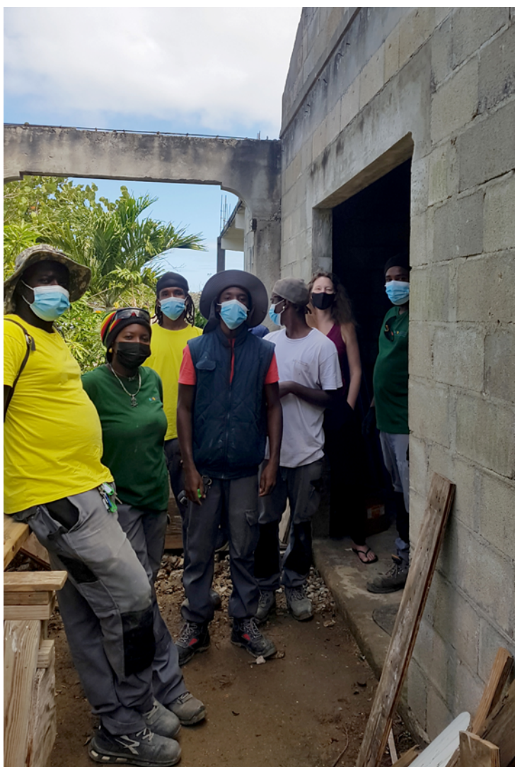
Équipe du chantier d'insertion à Quartier d'Orléans.